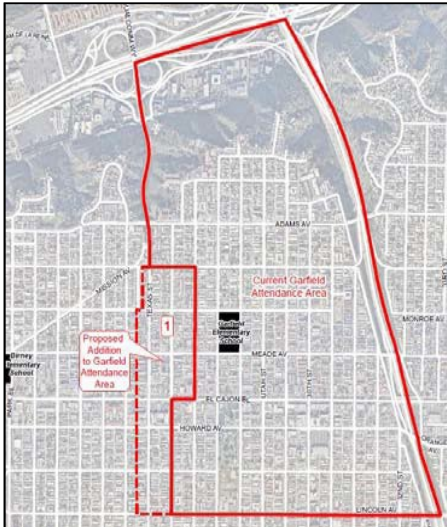
Reasignados a Garfield (Área 1 en los mapas)

4000-4598; 4301-4599 Arizona St 2320-2598; 2321-2499 El Cajon Blvd 4300-4598 Hamilton St 2400-2498; 2323-2499 Howard Ave 2320-2498 Lincoln Ave 2401-2599 Madison Ave 2400-2598; 2321-2599 Meade Ave 2400-2598; 2321-2599 Monroe Ave 2400-2498; 2401-2499 Polk Ave 4000-4598; 4001-4599 Texas St