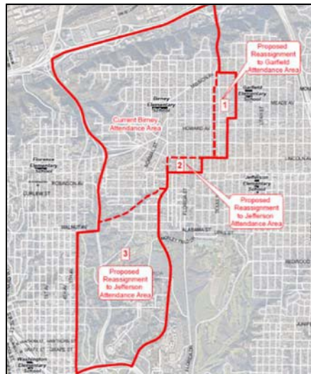
Reasignados a Jefferson (Área 2 y 3 en los mapas)

4000-4598; 4301-4599 Arizona St 2320-2598; 2321-2499 El Cajon Blvd 4300-4598 Hamilton St 2400-2498; 2323-2499 Howard Ave 2320-2498 Lincoln Ave 2401-2599 Madison Ave 2400-2598; 2321-2599 Meade Ave 2400-2598; 2321-2599 Monroe Ave 2400-2498; 2401-2499 Polk Ave 4000-4598; 4001-4599 Texas St